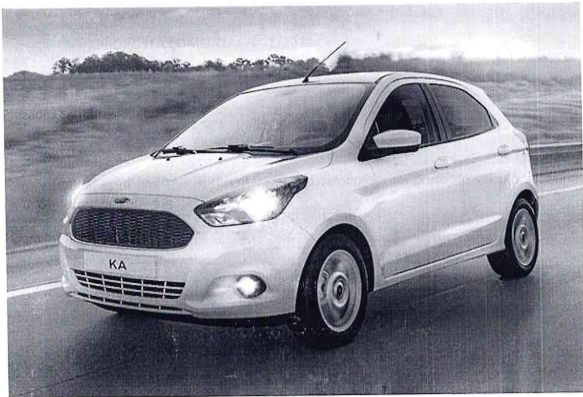
Figura meramente ilustrativa

Temos a satisfação de apresentar para vossa apreciação, preço do veículo da marca Ford, conforme abaixo: