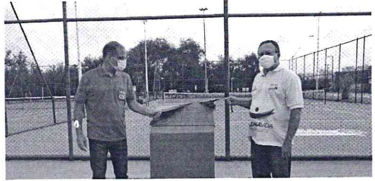
Vice-governador e secretário de Esporte e Lazer entregaram o Parque revitalizado