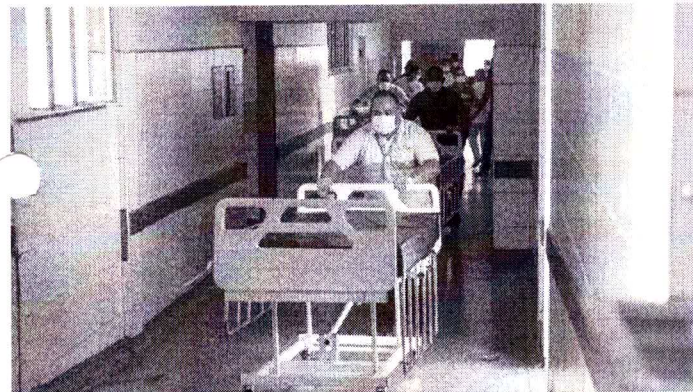
Ao todo, serão entregues 250 novos leitos completos nas unidades, aparelho de ultrassonografia, além de colchões para macas e camas