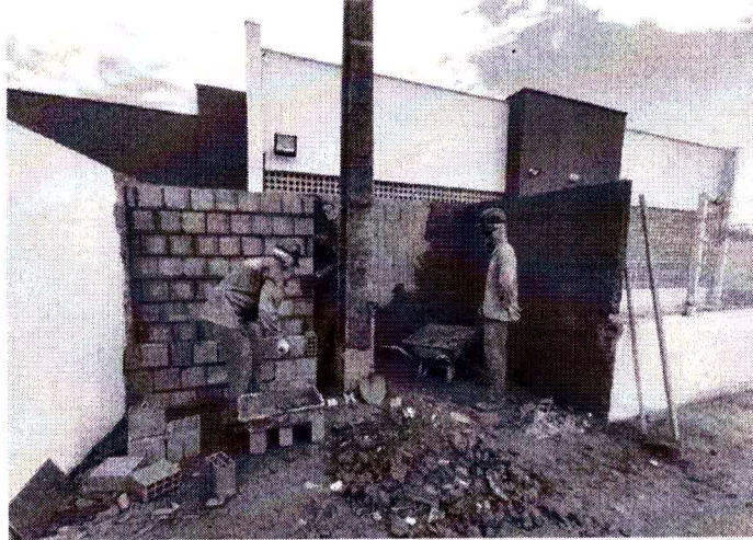
Com obras em fase de finalização, espaço será inaugurado este mês

O secretário Felipe Camarão ressaltou a importância da creche para a população. “Mas uma parceria frutífera da Secid com a Seduc. Além da maravilhosa Escola Professor Luísão, que foi entregue pela Secid com 12 salas de aula e ginásio poliesportivo, vamos entregar a primeira creche em tempo integral da rede pública da nossa capital. O governador Flávio Dino determinou para as nossas equipes que fizessem uma