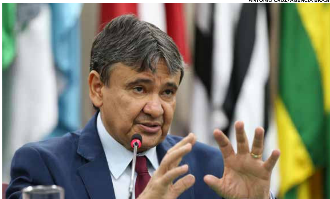
O ministro Wellington Dias disse que será feito um "pente-fino", para atualizar os dados dos beneficiários, por meio de uma busca ativa

O Bolsa Família é voltado para famílias em situação de vulnerabilidade econômica e social. Para serem habilitadas, elas precisam atender critérios de elegibilidade, como apresentar renda per capita classificada como situação de