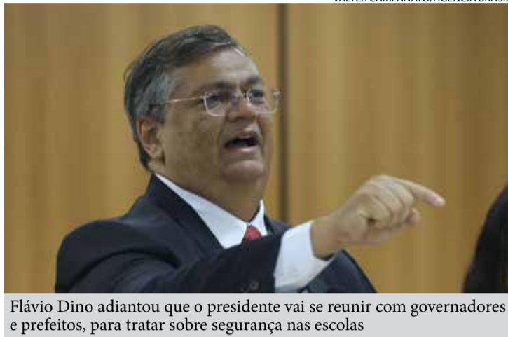
Flávio Dino adiantou que o presidente vai se reunir com governadores e prefeitos, para tratar sobre segurança nas escolas

“Por intermédio do monitoramento que as empresas são juridicamente obrigadas a