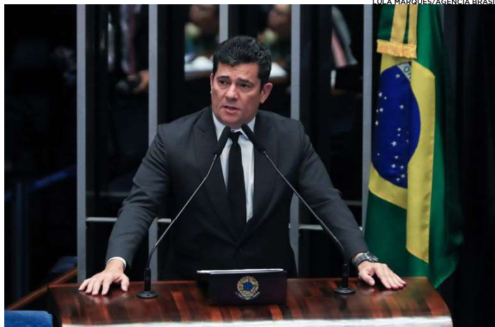
Senador Sergio Moro, durante discurso na tribuna do Senado, onde falou sobre atentado contra ele e sua família

Para o ministro da Justiça e Segurança Pública, Flávio Dino, com a operação, a Polícia