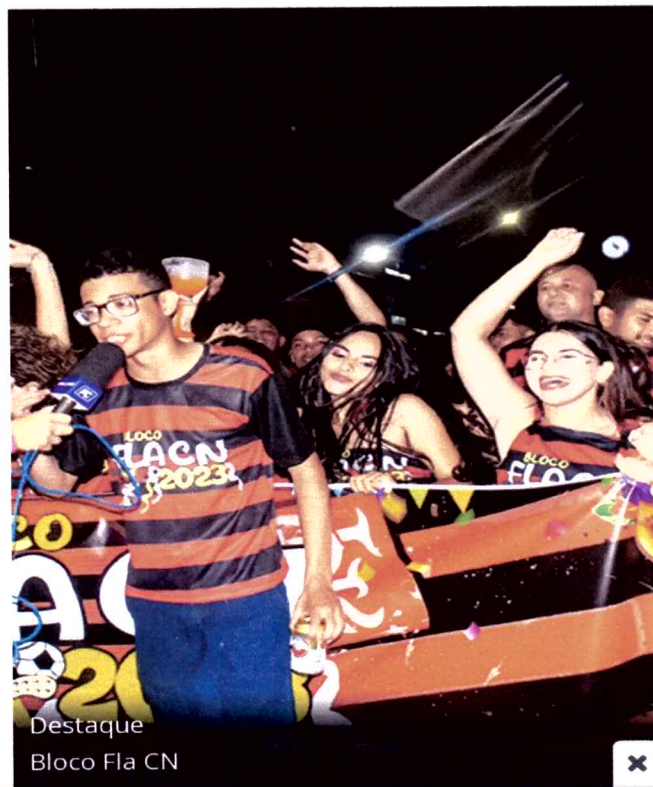
Destaque Bloco Fla CN

Postado em 20/02/2023 às 16:53 Atualizado em 23/02/2023 às 15:59