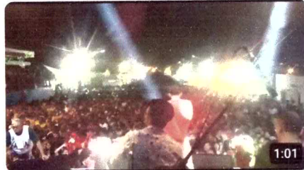
BANDA ZAMBALADA - País tropical2K18 45 visualizações · há 5 anos