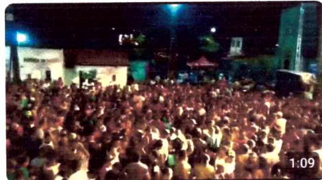
Zambalada - Carnaval - 2018 - terça-feira 64 visualizações · há 5 anos