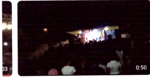
BANDA ZAMBALADA - ABRIL 33 visualizações · há 5 anos