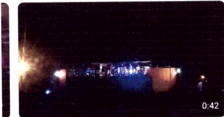
Banda Zambalada no Trio Elétrico Rick Som em Chapadinha - Maranhão 418 visualizações · há 6 anos