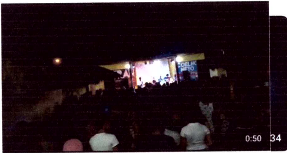
Z BANDA ZAMBALADA - ABRIL ZAMBALADA · 33 visualizações · há 5 anos