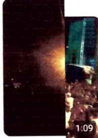
Banda Zambalada 242 visualizações · há 5 anos