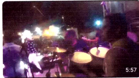
Zambalada - No Carnaval2018_Léo Becker 32 visualizações · há 5 anos