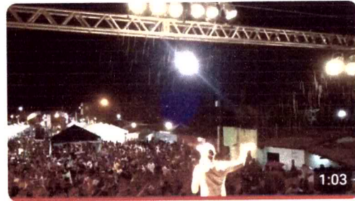
ZAMBALADA - ARERÊ - SACUDIUI 61 visualizações · há 6 anos