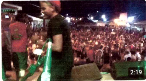
Banda Zambalada - Nosso Som 215 visualizações · há 5 anos