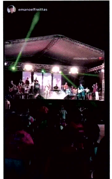
BANDA SWING BOM