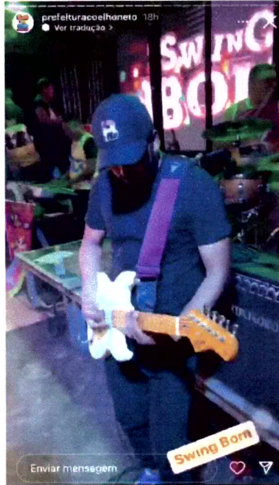
BANDA SWING BOM