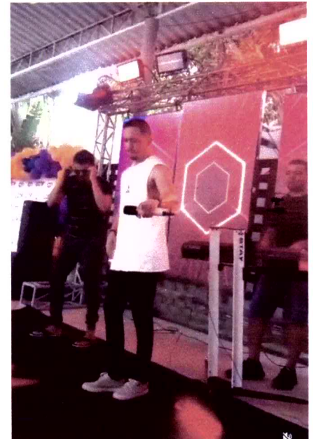
ESQUEMA LEO & YAGO

Rua Raimundo Sérvulo de Lima, 209 – Centro Contato: (98) 98196-3539 – e-mail: chiquinhomusica1234@gmail.com Coelho Neto - MA