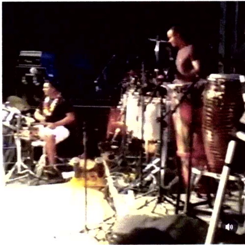
BANDA SWING BOM