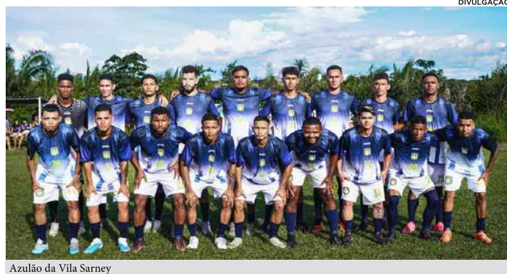
Azulão da Vila Sarney

Neste domingo (28), aconteceu o primeiro confronto das semifinais da 31ª Copa Interbaixos de Futebol Amador, competição promovida pela Associação de Clubes de Futebol Amador do Maranhão - ACFAMA, com apoio do Governo do Estado do Maranhão, através da Sedel, por meio da Lei de Incentivo ao Esporte e do Supermercado Mateus. O Ibis do Iguaiá e Azulão da Vila Sarney vão jogar no campo do Juventus (Quebra Pote), às 10h. O segundo confronto será entre Real Madri e Esquadrão de Aço, no dia 04/08/2024, às 10h no estádio Guiberto Alves (Fumacê), no Anjo da Guarda. Em ambos os jogos não tem favoritos. As