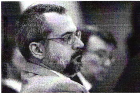
Abraham Weintraub, durante apresentação do Compromisso Nacional pela Educação Básica, em Brasília

Medida está prevista no Compromisso Nacional pela Educação Básica