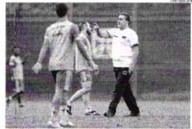
Luxemburgo terminou o primeiro turno com a zaga sendo montada

O elenco do Flamengo, que participou de um trabalho regenerativo ontem, volta a treinar nesta sexta-feira à tarde. No sábado, uma atividade pela manhã encerra a preparação para o jogo.