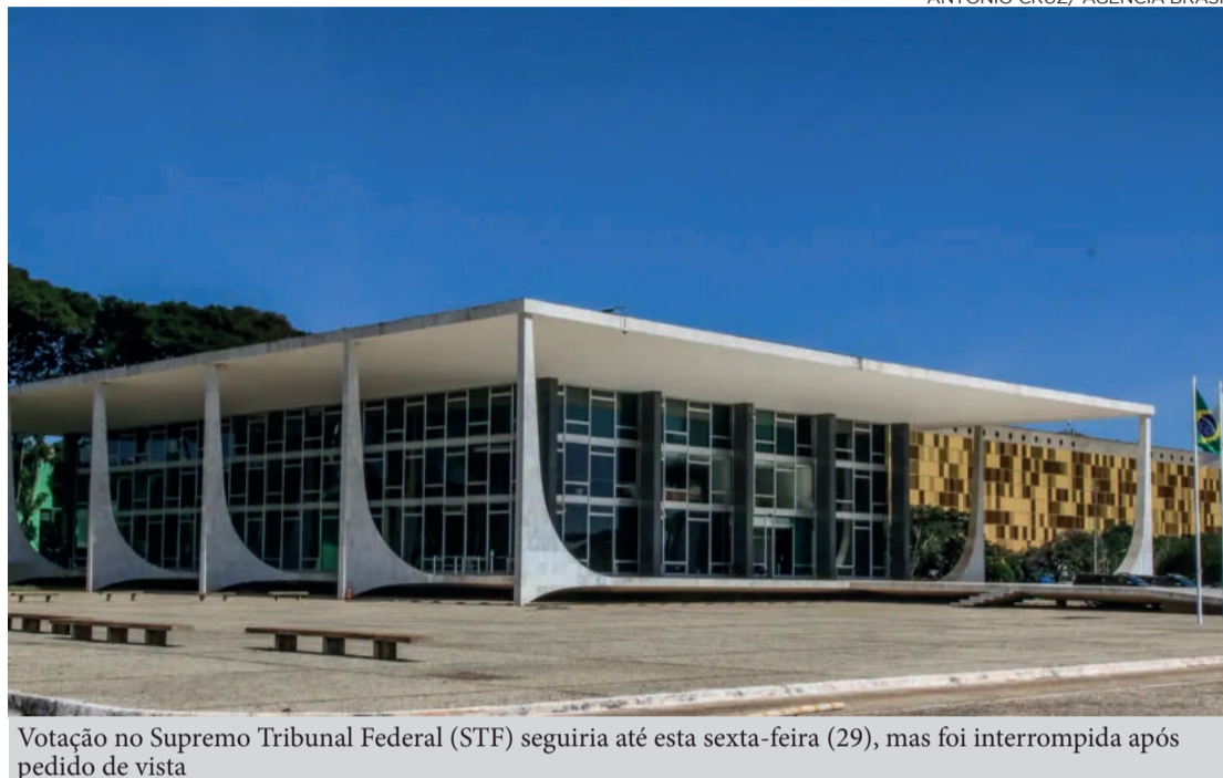
Votação no Supremo Tribunal Federal (STF) seguiria até esta sexta-feira (19), mas foi interrompida após pedido de vista

Segundo o Mapa da Inadimplência e Renegociação de Dívidas, elaborado pela empresa de garantia de crédito