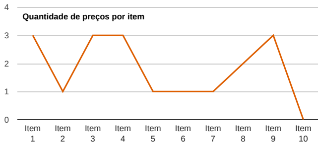
Quantidade de preços por item