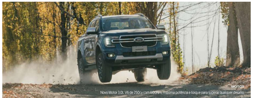
MOTOR Novo Motor 3.0L V6 de 250cv com 600Nm, máxima potência e torque para superar qualquer desafio.