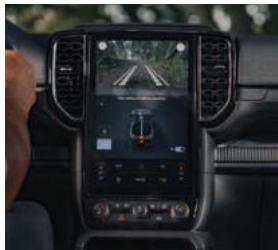
Navegador Off-road, a ferramenta perfeita para explorar os terrenos mais desafiadores.