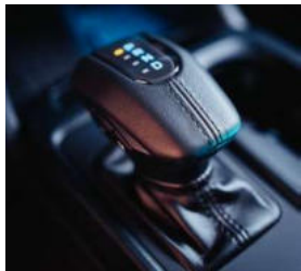
Cambio eletrônico de 10 velocidades.