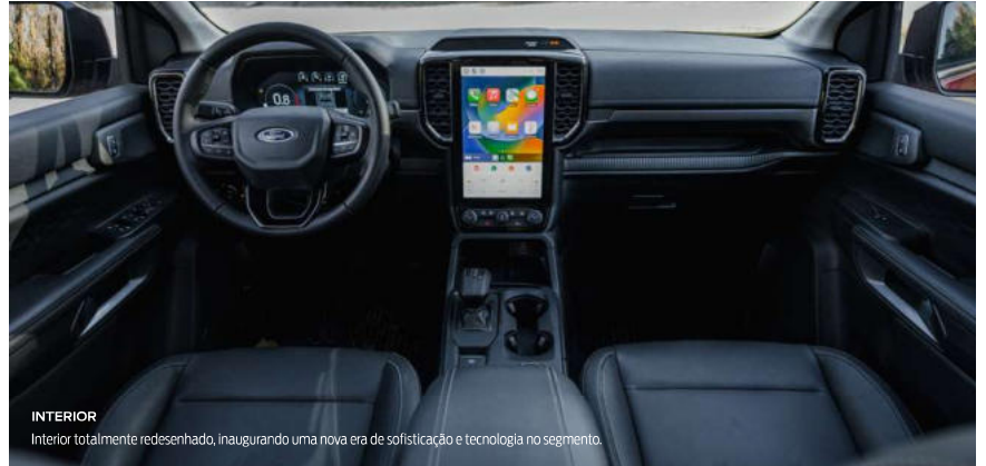
INTERIOR Interior totalmente redesenhado, inaugurando uma nova era de sofisticação e tecnologia no segmento.