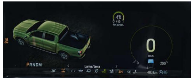
6 MODOS DE CONDUÇÃO Normal, Eco, Escorregadio, Rebocar/Transportar, Lama/Terra e Areia.