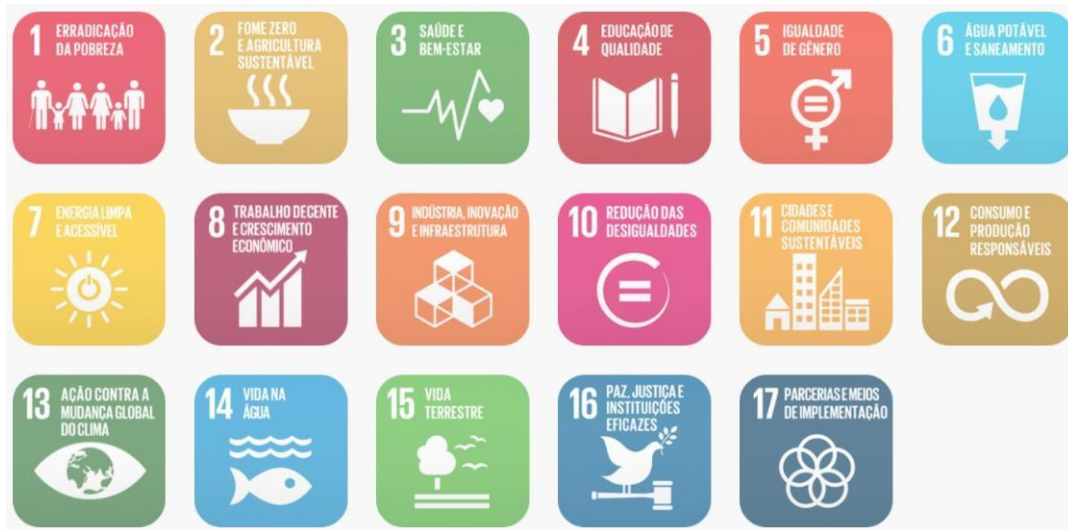
Figura 02: Objetivos de Desenvolvimento Sustentável